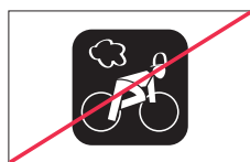
Kein Einfügen oder Verändern von Bestandteilen, z. B. Graphiken, Logo, Text, etc.